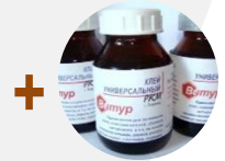
+ универсальный клей Витур-ПКМ