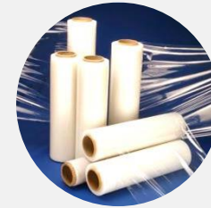
термопластичная полиуретановая пленка